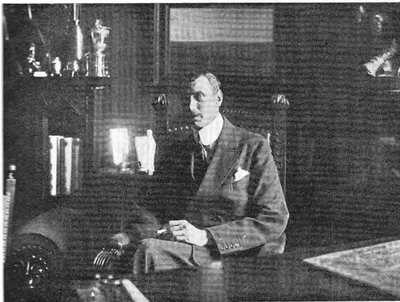
Hs. Maj. Kongen.