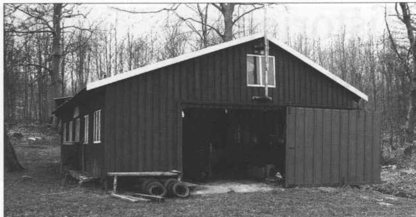
Det lille værft "Udsigten"

Nu mødes vi hver onsdag eftermiddag og pusler om vore "skibe", i denne vinter har vi påbegyndt restaureringen af en jolle, der er bygget på værftet i 1961.