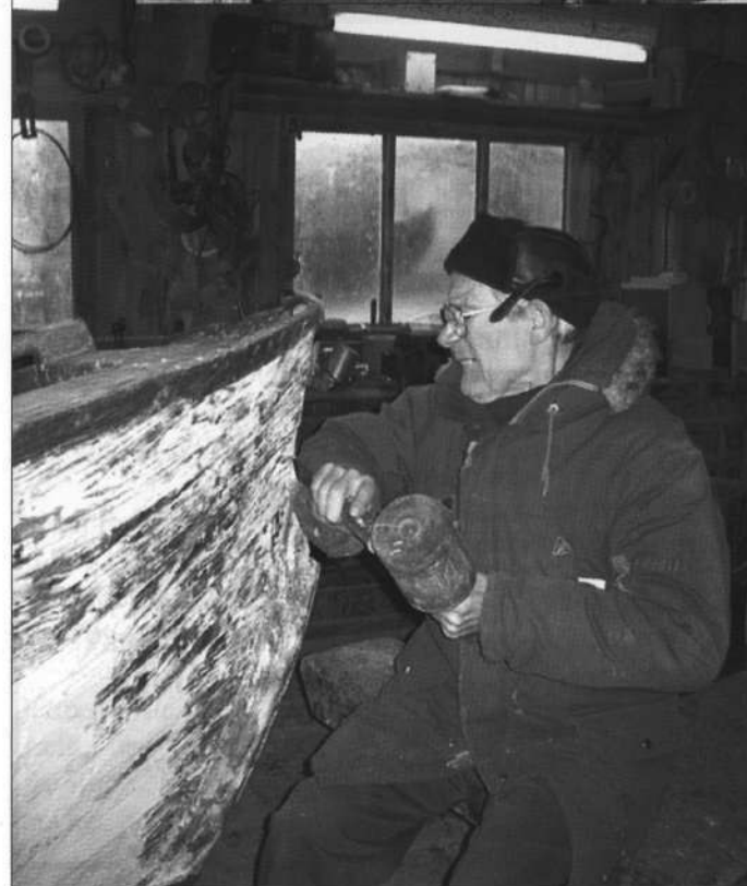
Bådelaugets medlemmer er i gang med det evige vedligehold.