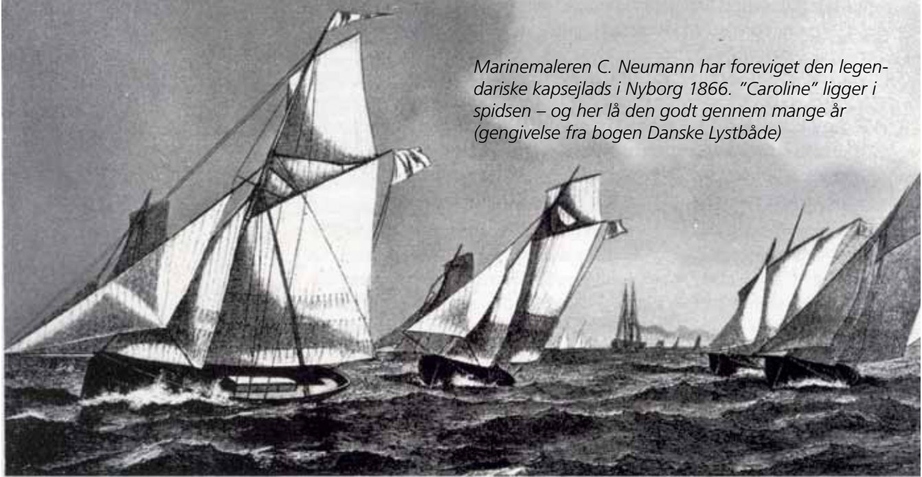
Marinemaleren C. Neumann har foreviget den legendariske kapsejlers i Nyborg 1866. "Caroline" ligger i spidsen – og her lå den godt gennem mange år (gengivelse fra bogen Danske Lystbåde)

give den genopståede "Caroline" status som bevaringsværdigt fartøj – ikke mindst ud fra foreningens erklærede mål at bygge båden "... så tæt på originalen hvad angår udformning, materialer og byggemetoder som muligt. Der anvendes egetræ i skroget, trænagler og kobbersøm/ klinker til påhæftning af hudplanker."