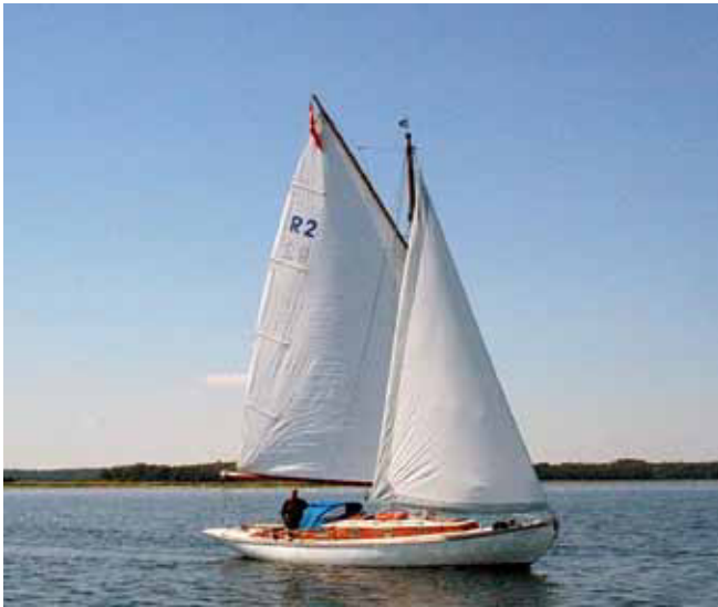
Anakonda for et par år siden på Roskilde Fjord

langtursberetning i 1965, overdraget af overdommeren Mærsk McKinney Møller.