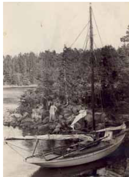
Anakonda på strandhugst i Bottenhavet 1920

Fra 1962 har jeg haft fornøjelsen – og arbejdet med at passe "Gamle Ane". Det var en brat